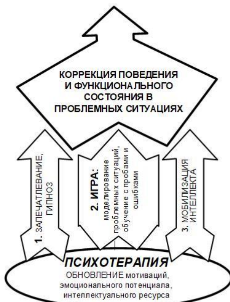
Рис. 2. Структура психологических методов помощи в проблемной ситуации.